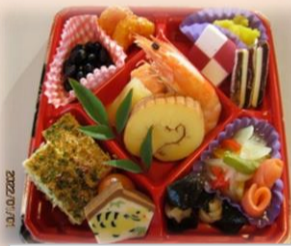
手作りおせち(行事食)