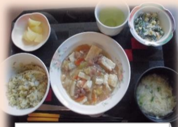
昼食(例) 高菜ご飯、かきたま汁 肉豆腐