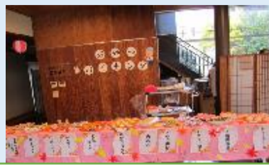
おやつバイキングは種類がたくさん