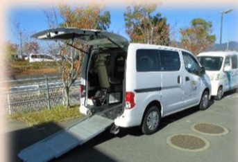
車椅子対応の送迎車も完備 安心して利用していただけます (車椅子対応車両は三台)