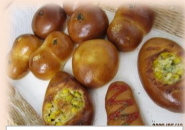
利用者の皆様に大人気月1 回の手作りパン