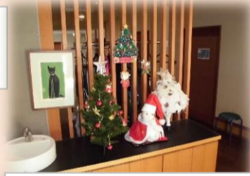
季節の飾りつけで皆様をお 出迎えます