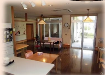
広いホールでは 他のご利用者との交流もできます