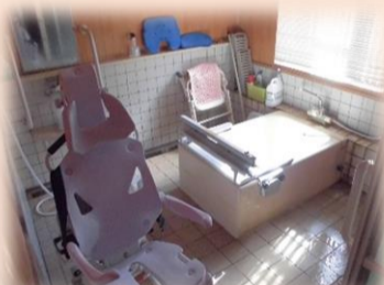
ゆったりと入る事が出来る浴 槽も完備しております