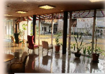
陽当たりの良い 広い中庭があります